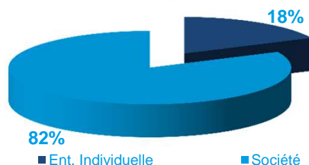
Créations d'entreprises en 2014 selon le statut choisi par le créateur